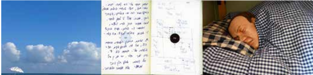
במרתפים (מחווה לאולריך זיידל) 2024