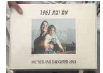
אמא ובת, 1963 פאזל של 1000 חלקים, תצלום על קרטון, דפוס אופסט, ארוז בקופסא, חתום וממוספר במהדורה 1/50