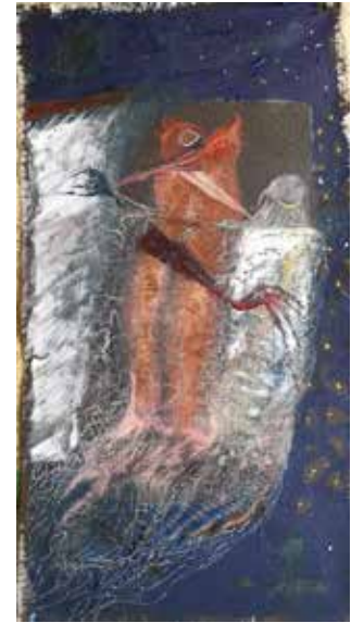
מרבד הקסמים 2021, שמן על בד פשתן פרום

כל ששן מפגיש אותי עם מישהי חדשה, מפתיעה ולגמרי לא מוכרת. כך לומדת להכיר את העולם דרכי, דרך ההתבוננות בטופוגרפיה של פניי.