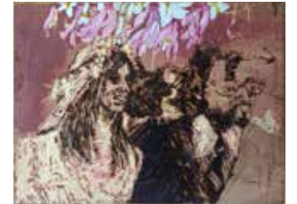
בדרך לחופה 2019, חריטה, צריבה ודבק ורוד על עץ לבוד