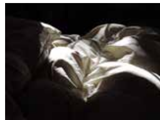
פוך 2016, הזרקת דיו