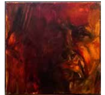
דיוקן עצמי 2024, שמן על בד