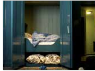
אמא שלי ישנה בצימר 2008, הדפסת פיגמנט על נייר ארכיוני

הולנד, טיול שורשים, אמא שלי ישנה בצימר ב-Lieveren הסמוך לכפר הולדתה Leek.