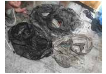
Large בגדים, שעווה וסיכות תפירה, 2023

הורי נפטר, סלונם המפואר התייתם. החיים נעלמו ממנו. הקרקע נשמטה בעבורי, וחטרונם בעולם - מכאיב ומאיים. הציורים נעשו שנתיים אחרי פטירת אימי.