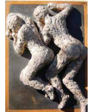
שתי דמויות שוכבות

2020, קולאז' מארבעה תצלומים, הדפסת פיגמנט על נייר ארכיוני