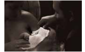
ללא כותרת 2023, צילום דיגטלי הדפס פיגמנט על נייר ארכיוני

27.10.2023 13:27:41. אור הפציע לנו בימים של אפלה.