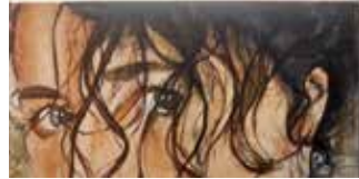
המבט שמן על בד, 2018