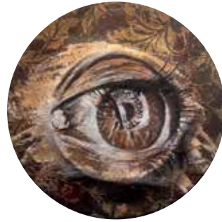
חסד ואמת נפגשו שמן על בד, 2020

באתי לפקח העינים ולדעת. לנעץ צירים בדלת אמות. באתי להחליף זיוות ולפתח. לחזות באישונים הנעים בין העולמות.