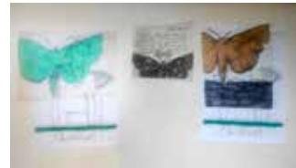
חלומה של אן

2009. רישום על נייר שקוף וצבע תעשייתי אפור מתוך הסדרה: נשר של כתובת קעקע