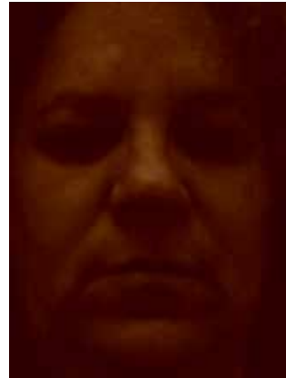
דיוקן עצמי כגאיה 2016, צילום מעובד הזרקת דיו

השמיכה נהפכת בדימוי לגלי ים לבנים, מרמזים על זמן חלימה, בין שינה לערות, בין מודע ללא מודע, בין נימנום לעוררות.