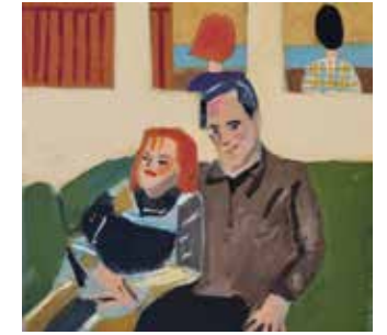
בלא כותרת 2024, אקריליק על בד

אחרי עשרים שנה היא אומרת הרעש היה בלתי נסבל הבירה עשתה לי בחילה אף פעם לא אהבתי ג'אז נשארתי בשבילך