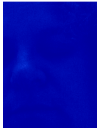
דיוקן עצמי כאמפיטריטה 2016, צילום מעובד הזרקת דיו