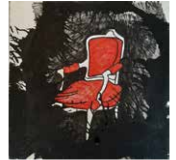
הסלון של אמא מרקרים ואקריליק על בד, 2022