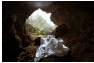
דיוקן עצמי על סף המערה 2020, צילום דיגיטלי במצלמת אינפראד. הדפסה בהזרקה דיו