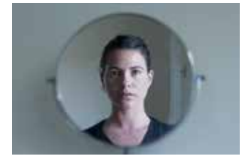
פורטרט עצמי 2012, צילום דיגיטלי, הזרקת דיו על נייר צילום, הדבקה על פרספקס

אני מסתכלת על עצמי, מסתכלת על עצמי, מסתכלת. רגע נהפך לרגעים ונעצר. מחשבות רצות ממני אליי עליי ממני אליי עליי מחשבות רצות נעצרות במבט אני רואה אותי לרגע עכשיו.