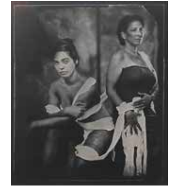
האמנית והמוזה שלה 2020, צילום קולודיון על לוח רטוב

החיתוך לחלקים קטנים והצלקות שנתרו על התמונה היפהפייה ההיא, ביטאו בזמנו, את הכאב שלי ואת המרד שלי במציאות הקשה של החיים, שלא מימשו את ההרמוניה המאושרת של אותה תמונה אינטימית.