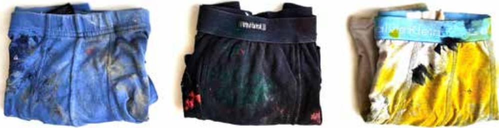
סמרטוטים מהסטודיו 2024, מיצב