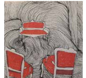
הסלון של אמא מרקרים ואקריליק על בד, 2022